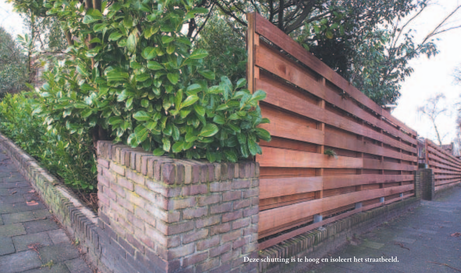
Deze schutting is te hoog en isoleert het straatbeeld.