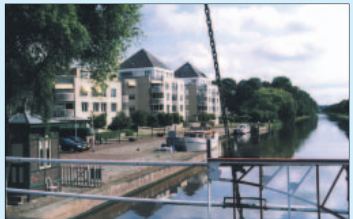
In januari kon voorkomen worden dat aan de Vliet een woontoren van 30 meter kon verschijnen als nieuwbouw van huize Rustoord.

‘Een voorbeeld is het nieuwe gemeentekantoor met appartementen aan de Rozenboomlaan. Een prachtig complex, waar echter een historische fout is begaan. Bij de planvorming tien jaar geleden is geen rekening gehouden met de aanleg van ondergrondse parkeergelegenheid. Daar bestaat nu wel grote behoefte aan, maar de klok is niet meer terug te draaien. Nu dreigt wederom zo’n fout gemaakt te worden rond de winkelpromenade Herenstraat. “Mooi Voorburg” vindt het een